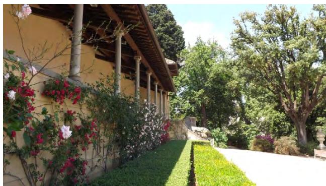
Bar/ristorante La Loggetta

Per i tre giorni dell'evento il Bar/Ristorante "La Loggetta" (kaffehaus) nel giardino riserverà agli espositori uno sconto sulle consumazioni.