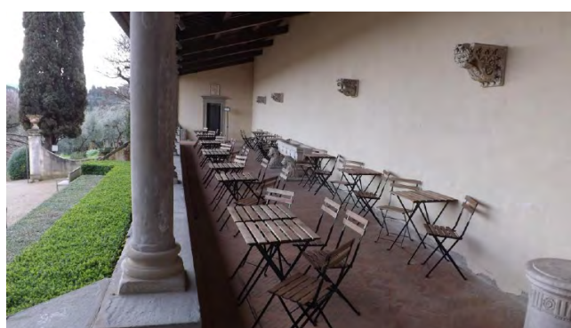
Bar/ristorante La Loggetta