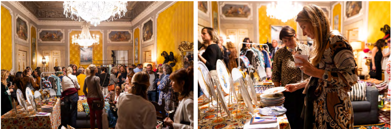
Due immagini dell'evento ATELIER lo scorso Ottobre 2019/Palazzo Baldovinetti, Firenze.

La prima edizione di ATELIER si è tenuta nell'Ottobre del 2019 negli splendidi saloni di Palazzo Baldovinetti a Firenze.